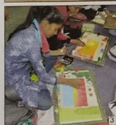
Participants performed in many competitions. (1-5)