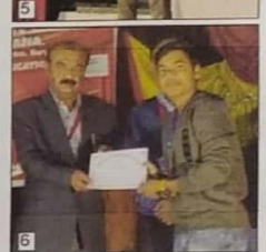
lighting the lamp (Middle 7), prize distribution by Principal (6).